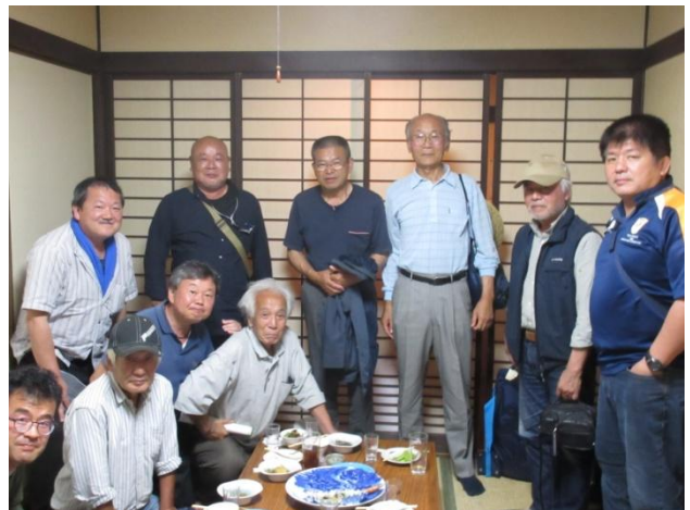
▲明日の朝も同行してくれる日置市の人達