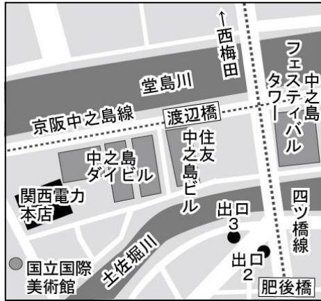
①大阪中之島公園「女性像」前 付近詳細図