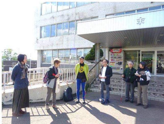
会見後、余市の皆さんと交流。短時間ではあったが有意義な時間だった。小樽の方とも合流。