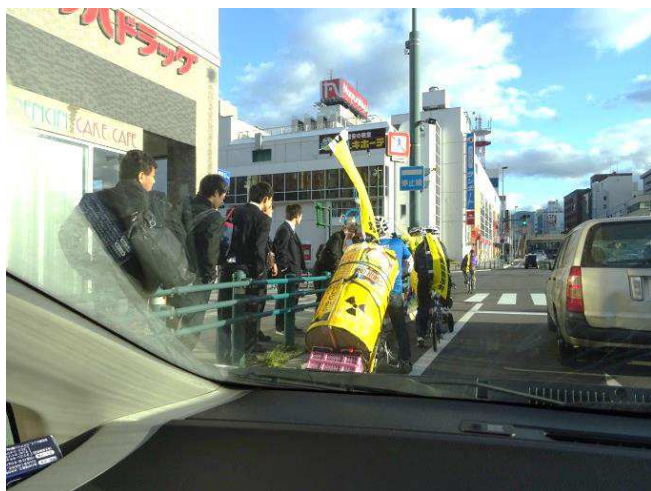
小樽市街。高校生と出会い会話を交わす